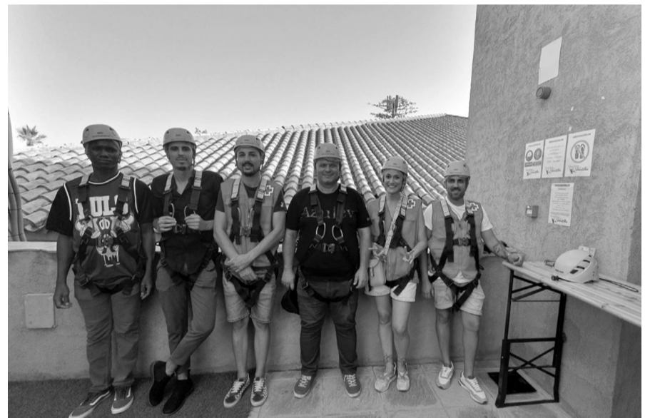
Acción lúdica en el marco del Proyecto Crece.

A través de esta iniciativa, las 100 personas que participan en ella son atendidas tanto grupal como individualmente, además de tratar de actuar con un enfoque comunitario para involucrar a la sociedad lepera. Así, se llevan a cabo acciones formativas que facilitan la inclusión y disminuyen la soledad, además de actividades culturales y lúdicas, las cuales posibilitan la creación de lazos entre los participantes. “Otra de las acciones que se realizan es el establecimiento de retos y metas por parte de los usuarios, que son guiados y acompañados por nuestros voluntarios para ayudarlos en su consecución” , apunta Morais, que nos comenta, acerca de la soledad no deseada, algo desgarrador: “Nadie reconoce que siente o padece soledad. Y es muy común que las personas que la padecen, le resten importancia o justifiquen su soledad. Es algo que nos ha impactado mucho” .