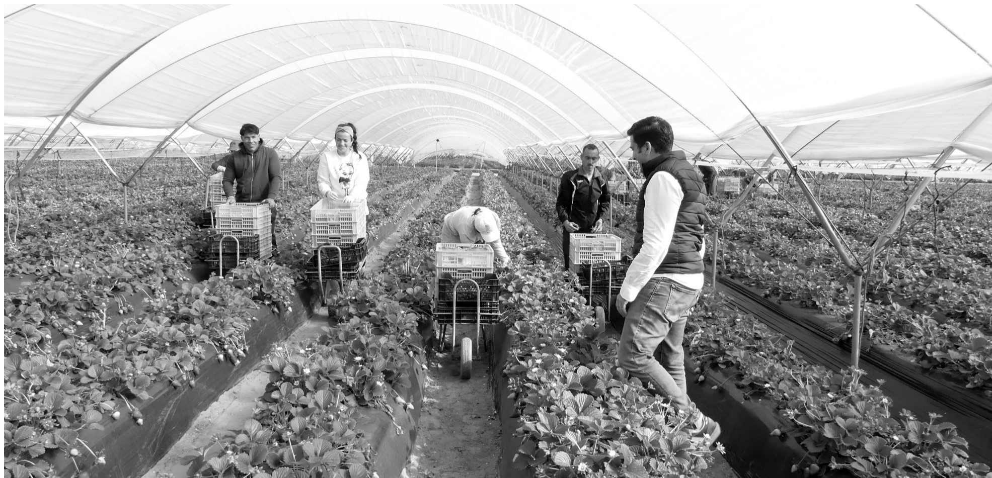
Cultivo de fresas en la finca de Agrícola Lena. Imagen de archivo.