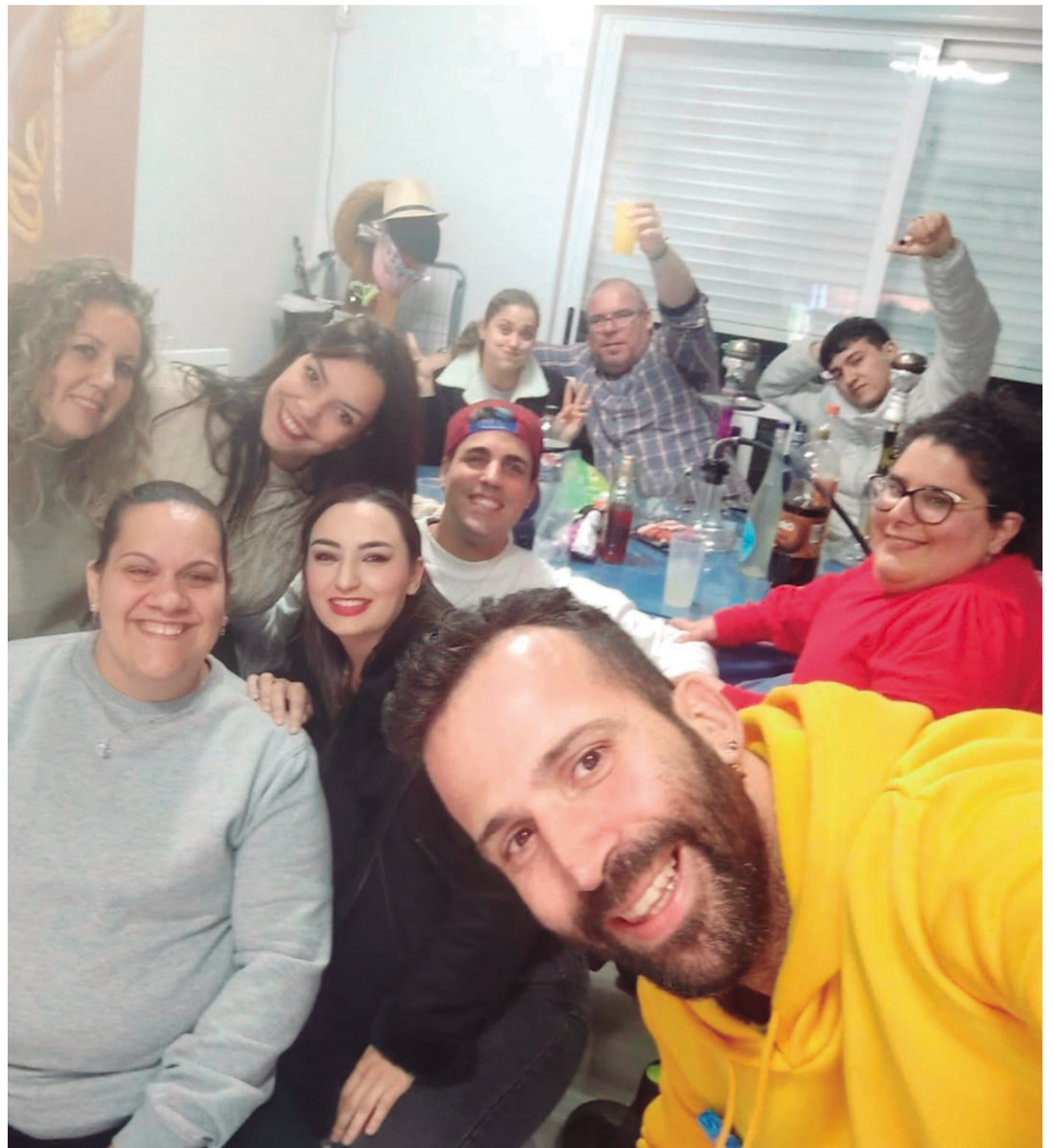
Un selfie para inmortalizar una noche entre amigos.

“Aunque a veces resulte difícil, creo que habría que hacer una reflexión acerca de los prejuicios que se tienen hacia las personas con alguna discapacidad, no dando por hecho, por ejemplo, que no son capaces de hacer algo”