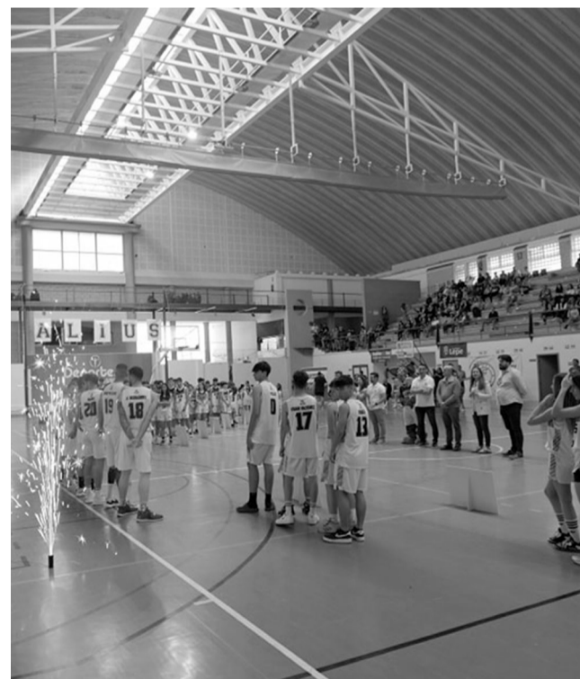
Los escalafones inferiores, un tesoro para el baloncesto lepero.