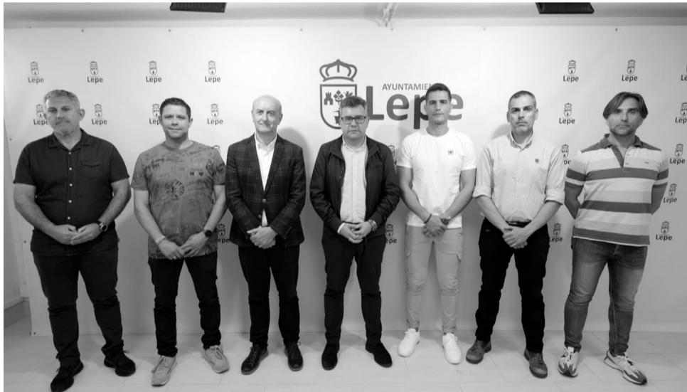
Imagen de la presentación del nuevo reglamento de horas de servicios de refuerzos de la Policía Local.

“El documento que se suscribe es el resultado de un trabajo coordinado que se sus-