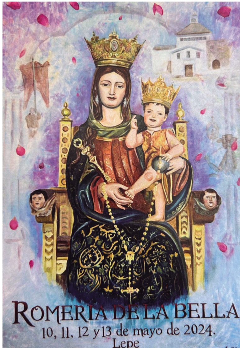
Cartel de la Romería de la Bella 2024.