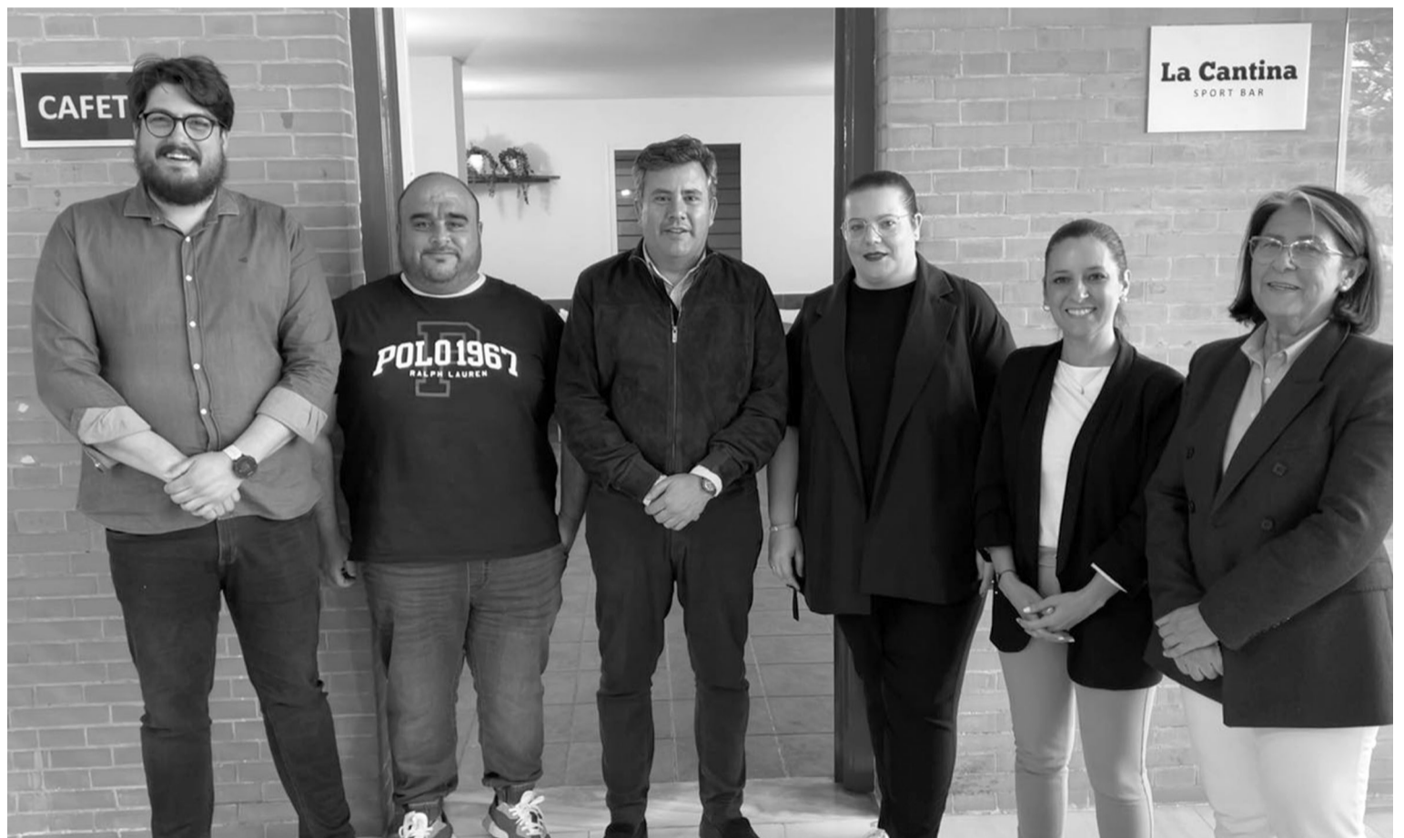
Fotografía del día de la inauguración de la Cantina Sport Bar.