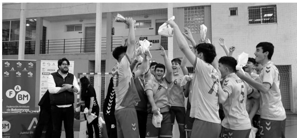
Nuestros jóvenes, celebrando el ascenso.

En la gran final esperaba el Trops Málaga, filial de uno de los mejores clubes de Andalucía en sección masculina. Jugando en casa, con un pabellón con enorme afluencia de público que animó a los