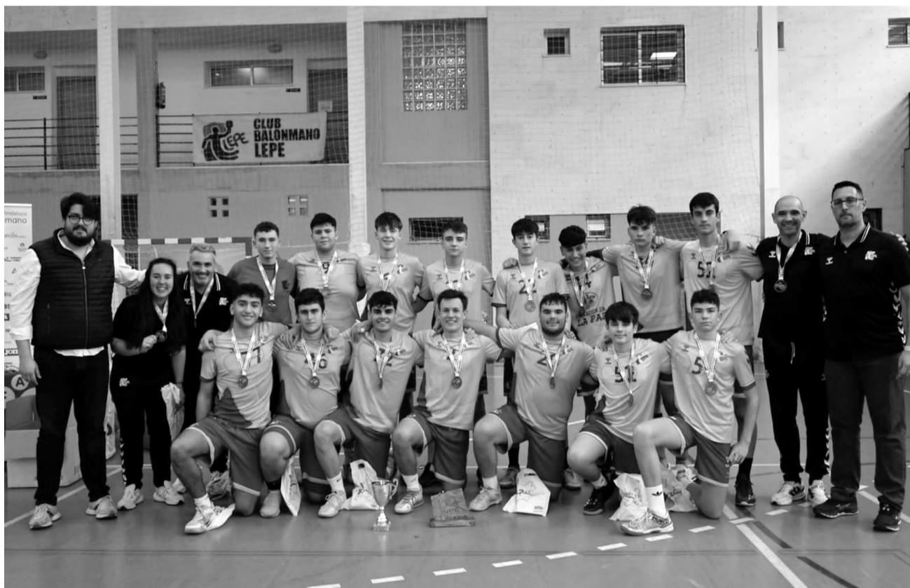
El plantel, posando en formación y con sus medallas.

FINAL FOUR La fase final del playoff se jugó en el Pabellón Sur de nuestra localidad, logrando los leperos el ascenso al terminar como subcampeones