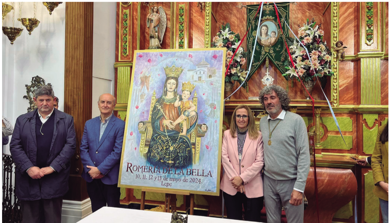
Imagen del acto de presentación del cartel anunciador de la Romería de la Bella 2024.

La ofrenda floral, el 10 de mayo a partir de las 20’00 horas en la parroquia, marcará los instantes previos al camino de ida, que arrancará a partir de las 18’00, inaugurando una Romería de la Bella 2024 que se extenderá hasta el lunes 13 del mismo mes.