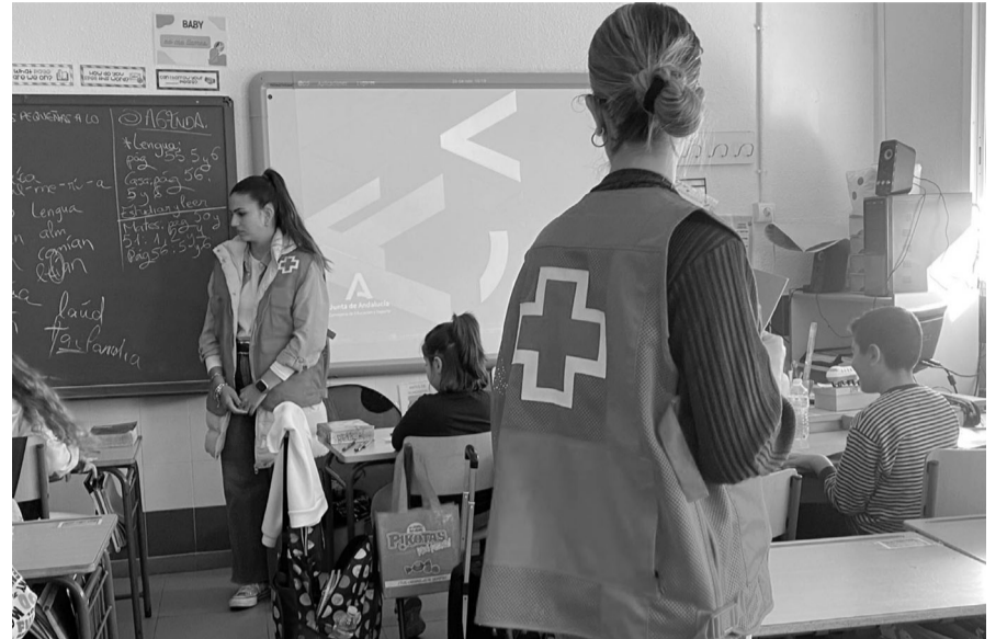
Las charlas en colegios, fundamentales para la educación en valores.