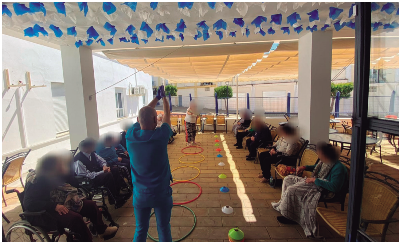
Usuarios participan de una actividad de estimulación sensorial y motriz.

DATOS Según la mayoría de los estudios recientes, en las próximas 3 décadas se multiplicarán los casos de Alzheimer y otras demencias