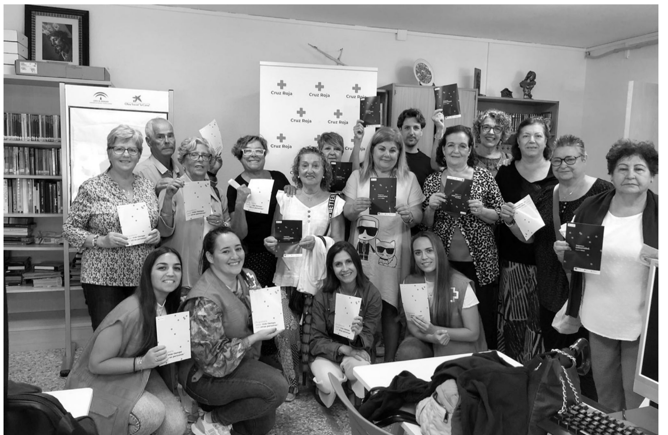
Actuar y concienciar sobre la soledad no deseada, objetivos del Proyecto Crece.

Iniciativas como el Proyecto Crece, y el resto de las múltiples acciones que Cruz Roja en Lepe tiene en marcha, se antojan totalmente necesarias en nuestro municipio, en el afán compartido de que nuestra sociedad sea cada vez más inclusiva y colaborativa. Es por ello que el giro de 180° que Cruz Roja Lepe ha dado en los últimos meses es una de las mejores noticias que podíamos recibir, pues el éxito de sus acciones será, en buena medida, sinónimo de poder seguir soñando con un mundo más justo.