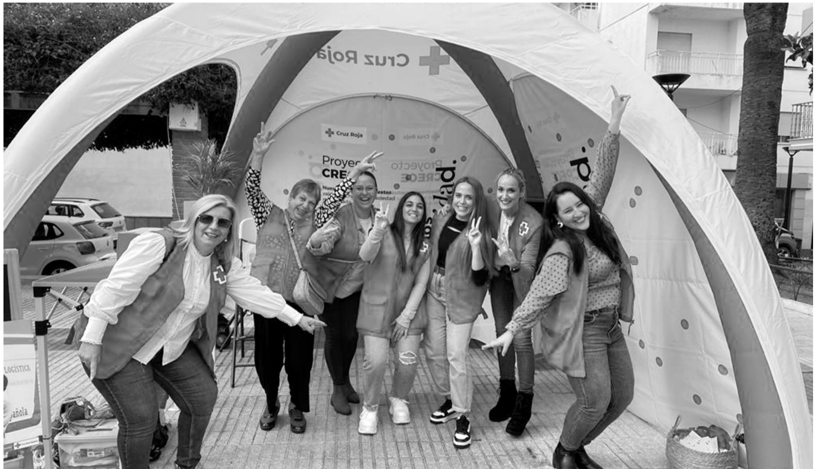
Atender a personas en riesgo de exclusión social y concienciar e involucrar en esta tarea a la ciudadanía son algunas de las metas que persigue la asamblea local de Cruz Roja.

A todo lo anterior se une su vinculación con movimientos socioculturales como el carnaval o la cabalgata de Reyes, la vida escolar a través de las asociaciones de padres y madres de alumnos, siendo presidenta durante 8 años del CEIP Alonso Barba, y colaborando, además, con asociaciones como ARO, Manos Unidas y múltiples actividades benéficas y altruistas. “También he colaborado escribiendo artículos para las publicaciones de los libros del 50 aniversario del colegio Alonso Barba y de los 40 años de Escultismo en Lepe. En febrero de 2020, tuve el honor de ser nombrada ‘Jiguera Mayor’ del Carnaval de Los Valientes en mi pueblo natal. En el año 2021, fui presentadora del cartel de las fiestas patronales de San Roque y el 28 de Febrero de 2023, día de Andalucía, fui nombrada Hija predilecta, lo que es para mí un honor”, nos