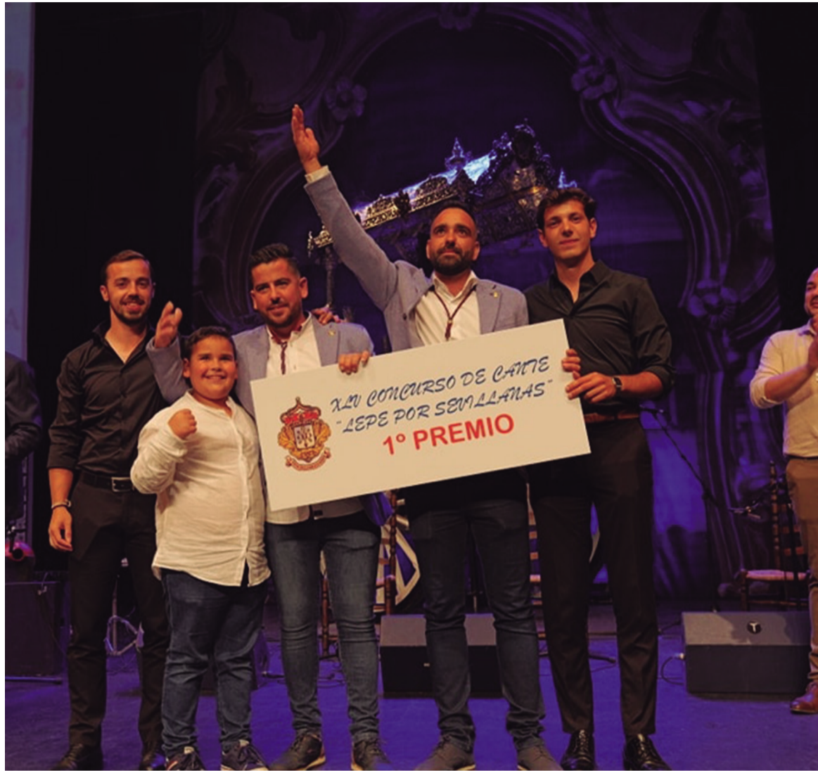
Un total de 11 participantes, entre grupos y solistas, concursaron en la XLV edición de 'Lepe por sevillanas', siendo 'Sentimiento Romero' quien se alzaba con el primer premio, 'Fe Romera' con el segundo premio y 'Tradiciones Leperas' con el tercero.