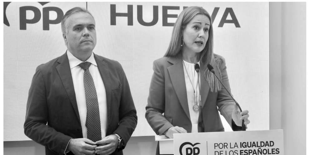
Imagen de rueda de prensa de los diputados nacionales del PP por la provincia de Huelva.

mensiones que se ven forzados a circular en parte por el arcén para evitar grietas y baches en el asfalto y vehículos particulares que sufren dicho deterioro” , lamentaba la diputada, afirmando también que “lo que tenemos claro desde el Partido Popular es que los onubenses tienen que ver que el dinero de sus impuestos, esos que el Gobierno ha subido hasta la asfixia para muchos, nos repercutan en nuestro territorio, sobre todo en la mejora de nuestras infraestructuras, por eso también valoramos la petición de un tercer carril para la A-49” .