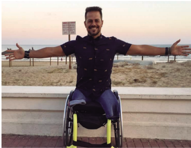
En la imagen de la izquierda, nuestro MVP posa ante la cámara. A la derecha, podemos verlo en una prueba ciclista.