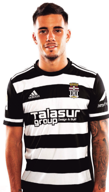
El habilidoso atacante cartayero, en su paso por el Cartagena.

– La primera pregunta, dados los rumores que han salido últimamente, es obli- gada. ¿Qué hay de la posibili-