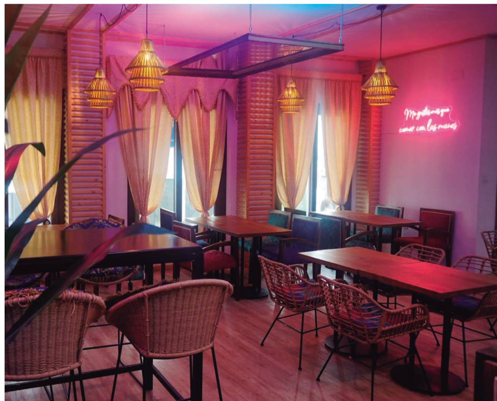
Imagen del interior de ‘La Gran Burguesa’.