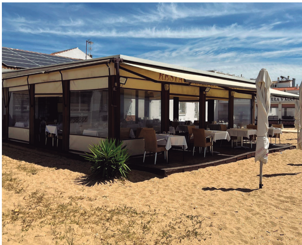
El enclave en el que está situado ‘La Patera’ es inmejorable.

de la amabilidad que en todo momento atesora, no quiere olvidarse de “dar las gracias a todos nuestros clientes por confiar en nosotros y por el trato que siempre nos dan. Nosotros seguiremos trabajando con el mismo cariño y la misma honestidad, porque entendemos que así es como se consiguen y se deben hacer las cosas” .