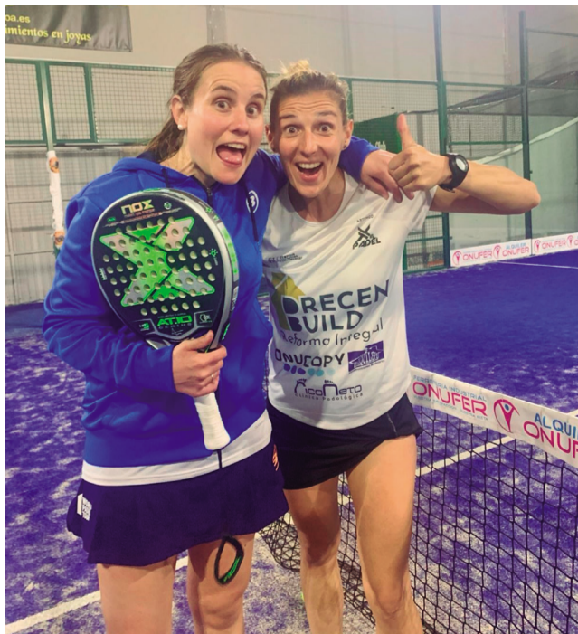
Nuestra vecina es una gran aficionada al deporte desde pequeña y trabaja en el área de Deportes del Ayuntamiento de Cartaya.

La discriminación por el predominio de la heteronormatividad impregna distintos ámbitos de la vida más allá de la orientación sexual. Y es que el cómo alguien vista, el cómo hable o las aficiones que tenga también son objeto de juicio social si se saltan los roles tradiciones de género. “Cuando yo era pequeña, ocurría bastante que si eras niña y te gustaba el deporte, ya te decían que eras ‘machorra’. Hoy en día pasa menos, pero aún sigue ocurriendo.