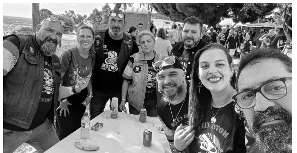
Miembros del club cartayero en la pasada edición de la Ruta de Villablanca.

Pero al margen de los eventos lúdicos centrados en el mundo de la moto, desde el club se lleva a cabo una enor-