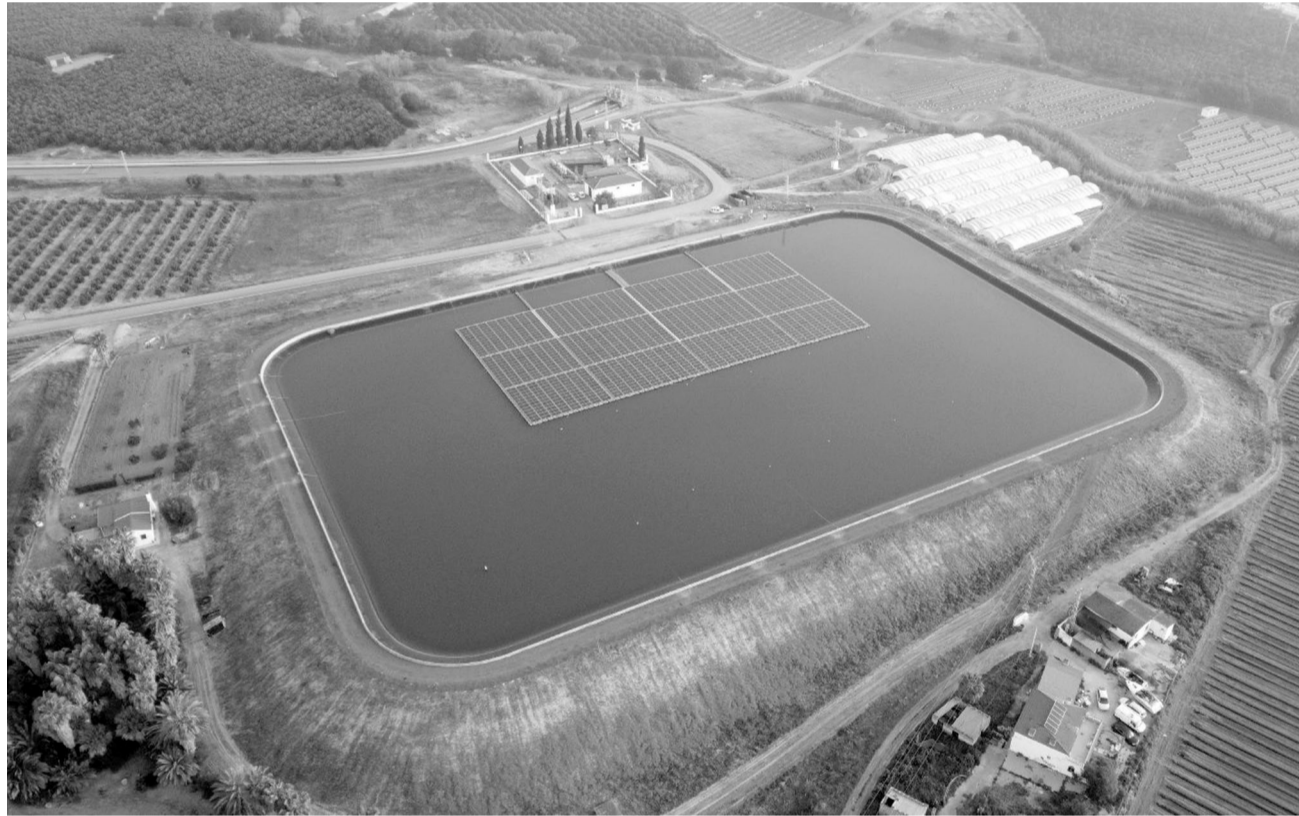
Una de las plantas fotovoltaicas para autoconsumo de la Comunidad de Regantes Chanza Piedras.

No obstante, el saldo de agua almacenada respecto al pasado mes de abril es negativo en los embalses de importancia para los regantes cartayeros. Y es que mientras el embalse del Chanza cuenta con una capacidad total de 338 hm 3 , y la Presa del Andévalo con 634 hm 3 , el embalse del Piedras, que es el que mayor porcentaje de agua al-