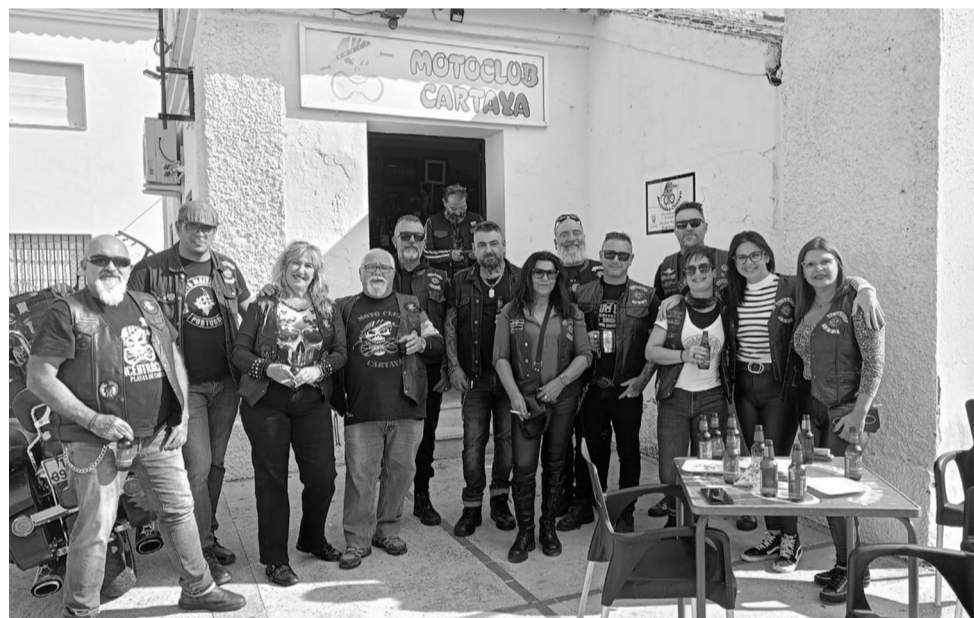
Los cartayeros reciben en su sede al club Moto Malta Faro Portugal.

en recoger caramelos y demás y, después, repartirlos por el pueblo en nuestras motos, todos vestidos de Papá Noel. A los niños les encantaba", apunta Soto.