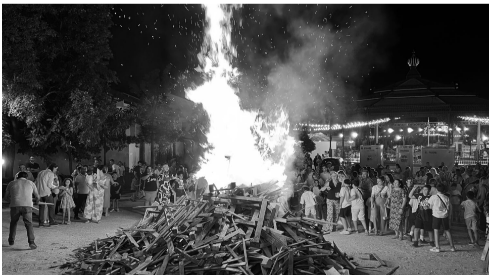
Los palermos quemaron lo viejo y lo malo en la gran hoguera de San Juan, para dar lugar a nuevas oportunidades y deseos...