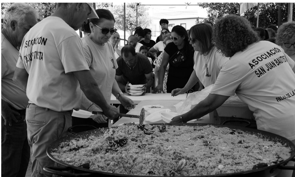
La Asociación de vecinos San Juan Bautista prepararon dos grandes paellas que degustaron todos los vecinos y visitantes.