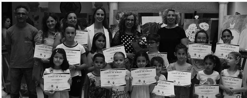
Los jóvenes alumnos del Taller Municipal de Dibujo posan orgullosos con sus diplomas.

Los diferentes talleres han puesto punto y final al curso con la entrega de diplomas que acreditan la adquisición de conocimientos en las diferentes disciplinas.