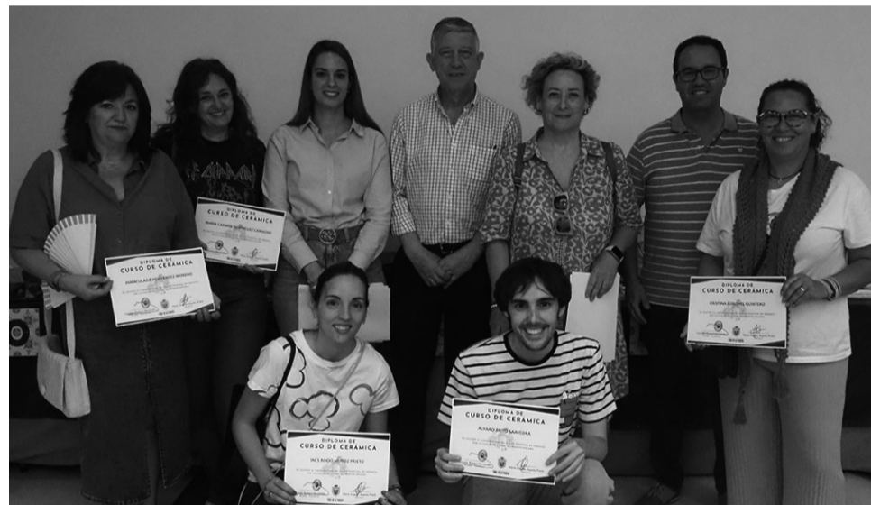
Concluye el Taller de Cerámica con enorme satisfacción de sus alumnos.