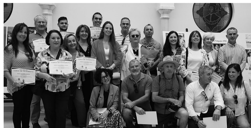
El Taller Municipal de Fotografía lanza a la calle a numerosos talentos de la imagen.