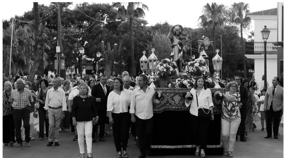
El Patrón procesionó, muy bien acompañado por los vecinos, por las calles de la barriada.