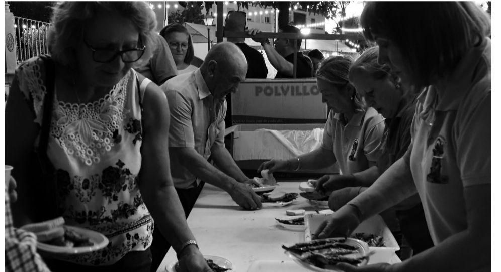
La gran sardinada gratuita es uno de los momentos más esperados por los vecinos.