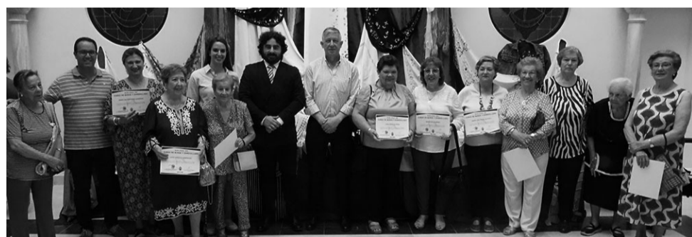
El Taller Municipal de Borne, enrejillado y bolillos concluye con una atractiva exposición.