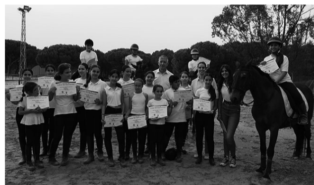
Los alumnos del Taller de equitación ya lucen sus diplomas.