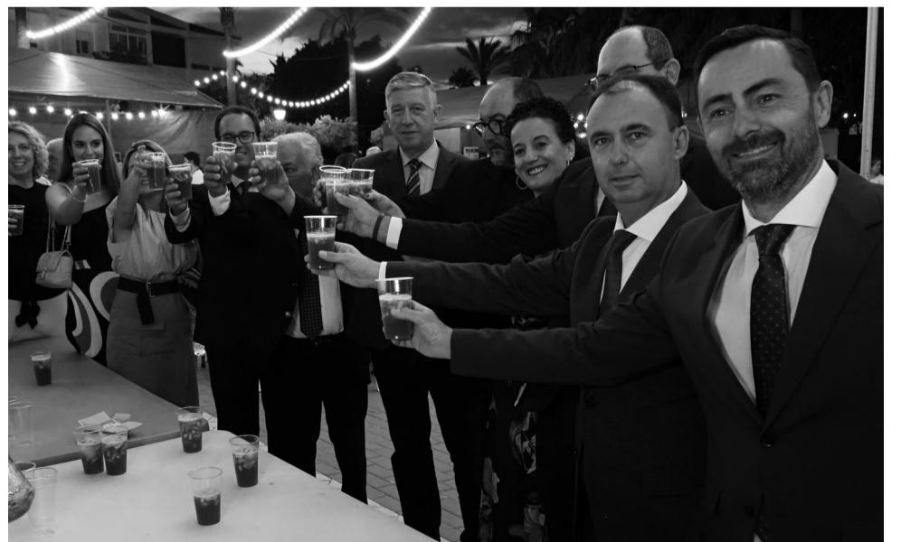
Alcalde y concejales brindaron con los vecinos con una refrescante y sabrosa sangría. Desde estas líneas nos unimos al brindis y os deseamos a todos un fantástico y sensacional verano.